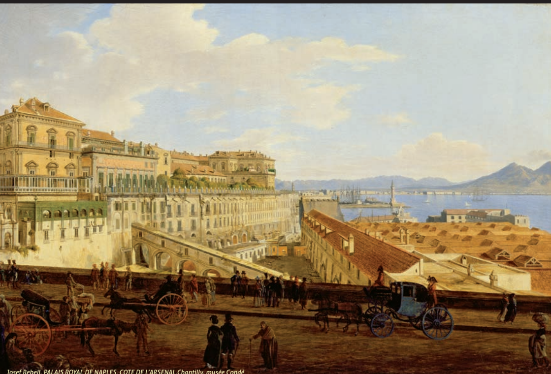
Josef Rebell, PALAIS ROYAL DE NAPLES, COTE DE L'ARSENAL, Chantilly, musée Condé

Université Lille 3, Bâtiment A, salle de séminaire de l'IRHiS (A1 152) Domaine du Pont-de-Bois, 59653 Villeneuve d'Ascq